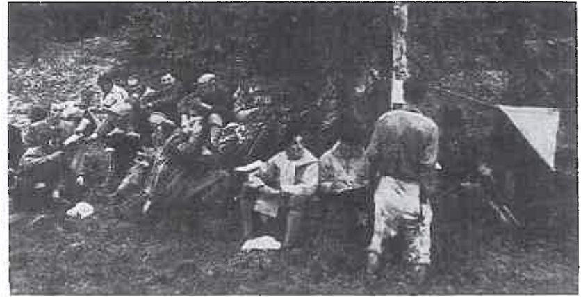
Det var folksomt, men etter omstendighetene tyst ved flagget på dagens 8. post. «Press section» bygger seg bakerst tilv.

Vestlandsløperne, som også kom til kort på flatlandet, selv om dagens terreng lå helt oppe i tregrensen.