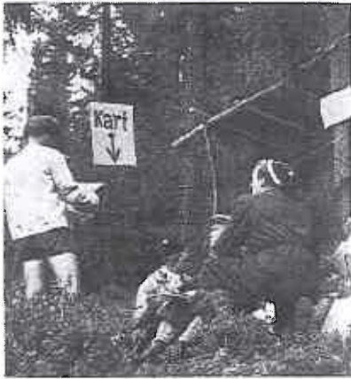
Kartet er utlevert, tidtagere sjekker opp, det bærer i vei ut i NM-løypa av 1952. God tur!

Kartet som ble utlevert 5 min. før start, viste et flatt og sannsynligvis lettløpt terreng i hellingen opp mot Raufjellet, hvor for øvrig også Birkebeinerløypa vanligvis passerer. 5 min.-fristen til å bli fortrolig med en noe uvant karttype som et skogskart i 1:25 000 og 10 meters ekvidistanse, var for kort. Løperne burde fått minst 10 min. til å bli litt fortrolig med kart, målestokk m. v. før de kastet seg ut i kampen om Gullmedaljen. Som så ofte i den senere tid på spesialkart, var stiene tatt ut og komplettert med enkelte andre detaljer som f. eks. en inntegnet setervold like før 1. post. Kartet viste seg godt og rikt på detaljer og muliggjorde postplaseringer av høy kvalitet. Dette var desidert et handicap for Trøndelagsløperne som er mer «grovminded» og likeså