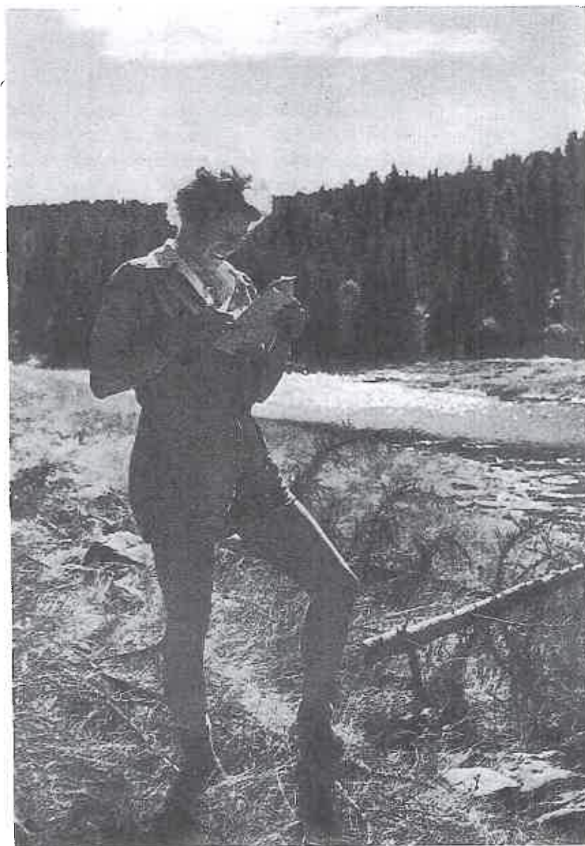
Og så var det til å gruble litt da! (Kongsvinger IL's løp.)